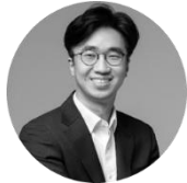
정상화 HSG 소장