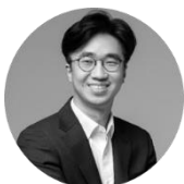
정상화 HSG 소장