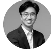
정상화 HSG 소장