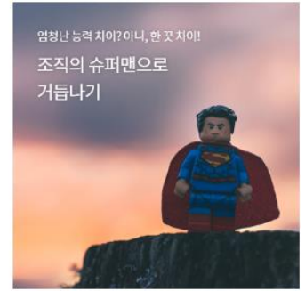
해결사형 인재, The Solver